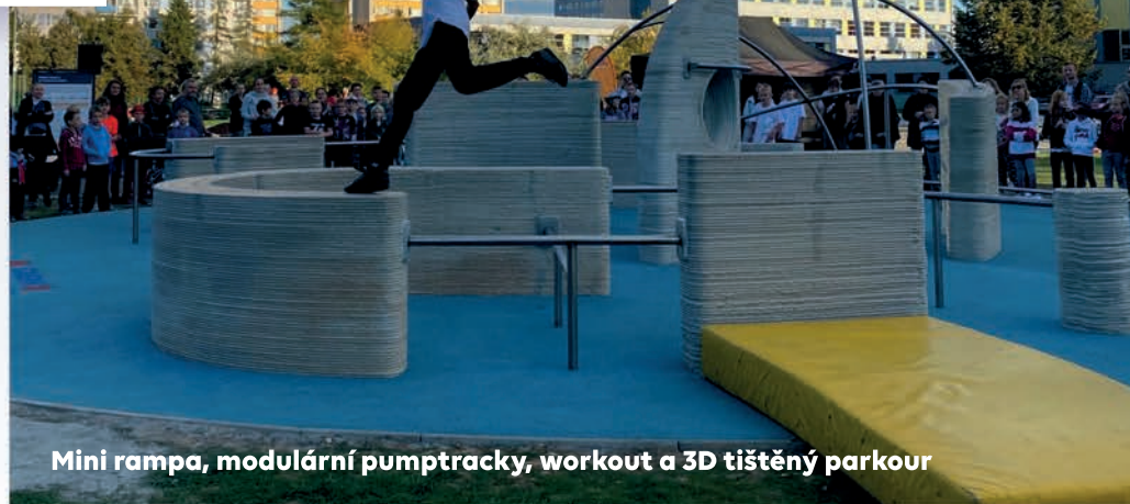
Mini rampa, modulární pumptracky, workout a 3D tištěný parkour

Nový volnočasový areál jsme prosadili při ZŠ Kupeckého (tzv. „Modrá škola“) a postupně dostával svou konečnou podobu. Je dokončena instalace mini rampy, víceúčelového modulárního pumptracku (liniový a okruh v celkové délce 100 m), minipumptracku pro nejmenší, workoutu a celosvětově unikátního 3D tištěného hřiště na parkour a základního mobiliáře. Do konce letošního roku by mělo být ještě dokončeno zázemí pro občerstvení a vodní prvek. V areálu přibyly také dva zcela nové graffiti prvky.