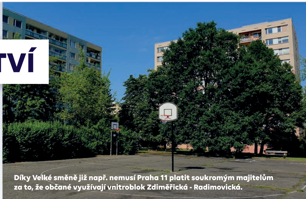
Díky Velké směně již např. nemusí Praha 11 platit soukromým majitelům za to, že občané využívají vnitroblok Zdiměřická - Radimovická.

V tomto volebním období se podařilo dotáhnout dva letité velké spory do konečné fáze. Prvním byl několikaletý soudní spor o tzv. pochozí zónu Háje, kde bylo historicky několik vlastníků (hl. m. Praha, Praha 11 a různí soukromí vlastníci), což způsobovalo nemalé obtíže v běžné údržbě a hlavně v nutných opravách. Tento spor se podařilo dotáhnout do zdárného konce a již se připravují dílčí opravy této pochozí zóny. Dalším velkým úspěchem bylo dotažení tzv. Velké směny zejména na Jelenách, kdy Praha 11 a hlavní město našlo dohodu se soukromou firmou a největšími