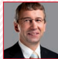
Jaromír Drábek místopředseda TOP 09

navrhne zrušení dědické daně, darovací daně a daně z převodu nemovitosti. Tím se výrazně sníží zbytečné administrativní zatížení jak občanů, tak i finančních úřadů. S řadou dalších návrhů a připravených kroků, jejichž cílem je zjednodušení výběru daní a tím úsporu nákladů občanů, firem i státu, se můžete seznámit v našem volebním programu.