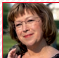
Ing. Ludmila Müllerová místopředsedkyně TOP 09 kandidát do PS PČR

Chceme sociální systém přetvořit tak, aby potřební byli dostatečně zabezpečeni. Na druhou stranu chceme, aby systém tvrdě postihl neoprávněné vyplácení dávek, na které všichni společně přispíváme.