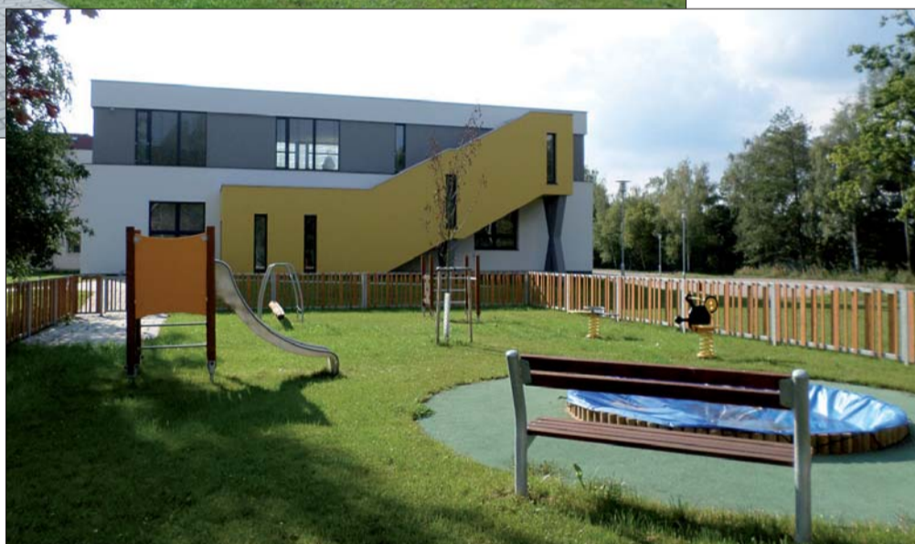
Nástavba mateřské a základní školy nad jídelnou ZŠ v Bystřici