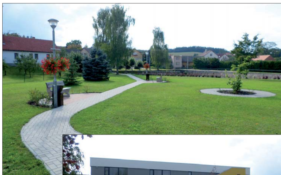
Náves v Nesvačilech realizovaná podle projektu Veroniky Horváthové - naší kandidátky č. 6

Přístavba mateřské školy, rozšíření sběrného dvora, dlouhodobý strategický plán, využívání nových komunikačních kanálů např. webové stránky www.nasebystrice.cz , facebook, a tím zajištění zpětné vazby občanům o práci zastupitelů, v rámci vytvoření koncepce návrhu dopravního řešení pro potřeby územního plánu, jsme se soustředili na problém odklonu kamionové dopravy přes Líšno a Bystřici, řešení cyklotras a pěších cest, z výše uvedených důvodů jsme prosadili zpracování územní studie.