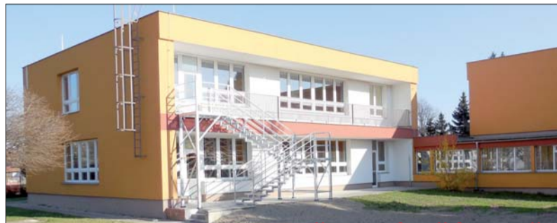
VYBUDOVALI JSME DVĚ NOVÉ TŘÍDY MŠ

Místní organizace TOP 09 měla ve svém programu ve stávajícím volebním období vybudování nové mateřské školy. Tento závazek se nám podařilo naplnit. V roce 2012 jsme vybudovali třídu v objektu základní školy v ul. Tyršova pro 28 nově nastupujících dětí. Těto akci navíc předcházela oprava havarijního stavu střechy. Třída byla slavnostně otevřena na začátku školního roku 2012.