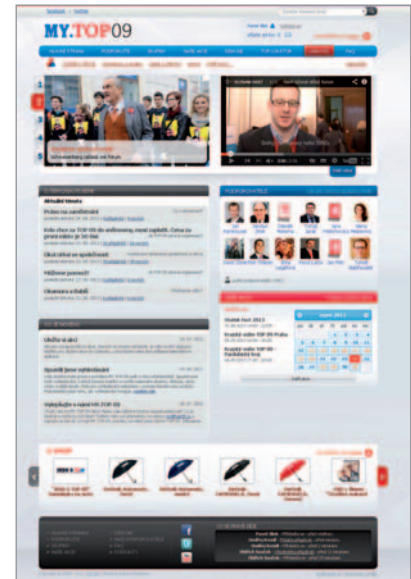
náhled portálu my.top09.cz