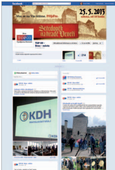
náhled facebookové stránky RO Brno-město