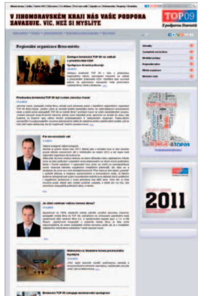
náhled sekce RO Brno-město v rámci celostátních stránek strany