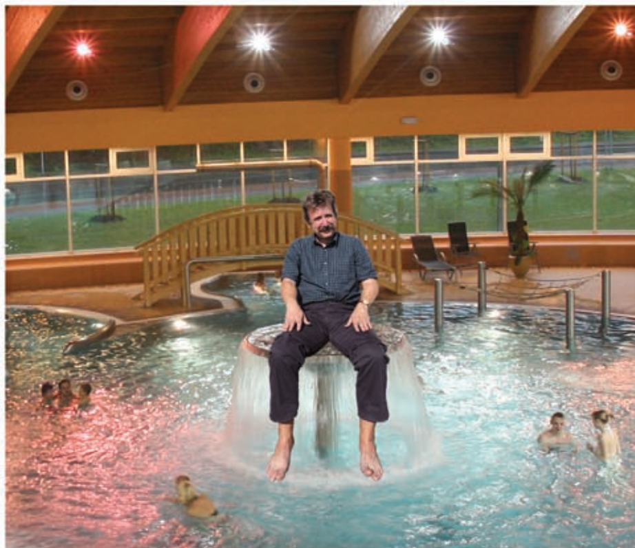
Nic není nemožné...

V devadesátých letech byl Rožnov progresivní, dynamicky se rozvíjející město. Vedení města se