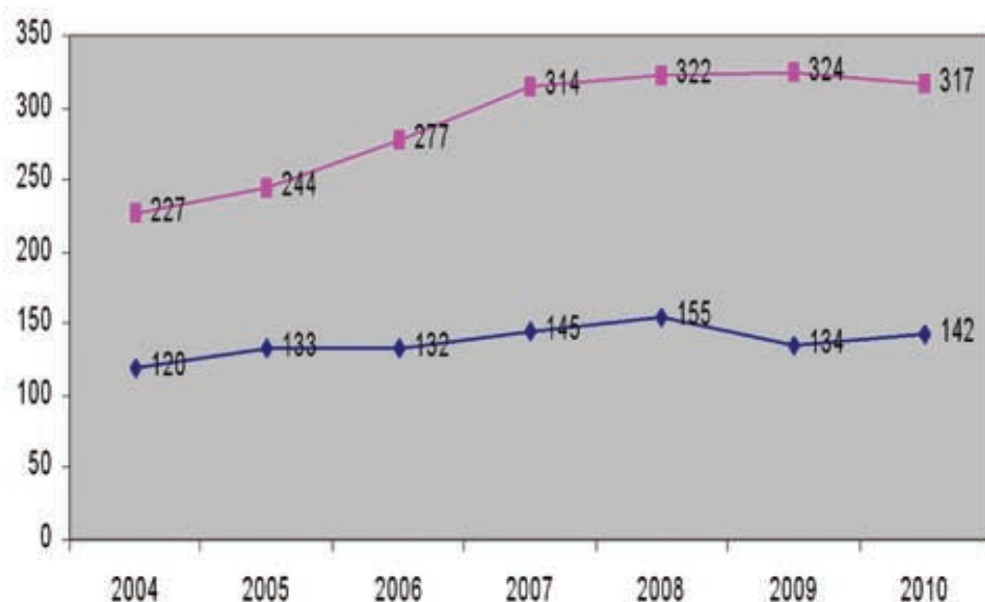
—●— daň v mil Kč —■— provozní náklady v mil Kč

Protože tam nacházejí mnohem lepší podmínky pro výstavbu. Levnější pozemky, připravená území k výstavbě, aktivní přístup obec-