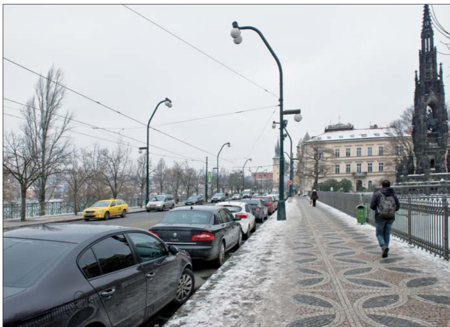
Neuralgický bod – Smetanovo nábřeží...

Na jednání zastupitelstva Prahy 1 v úterý 21. ledna 2014 byl vznesen požadavek na vypracování komplexní informace pro zastupitele o připravovaných, navrhovaných a uvažovaných změnách dopravních řešení v oblastech Smetanova nábřeží a Malé Strany v souvislosti s očekávaným zprovozněním tunelového komplexu Blanka.