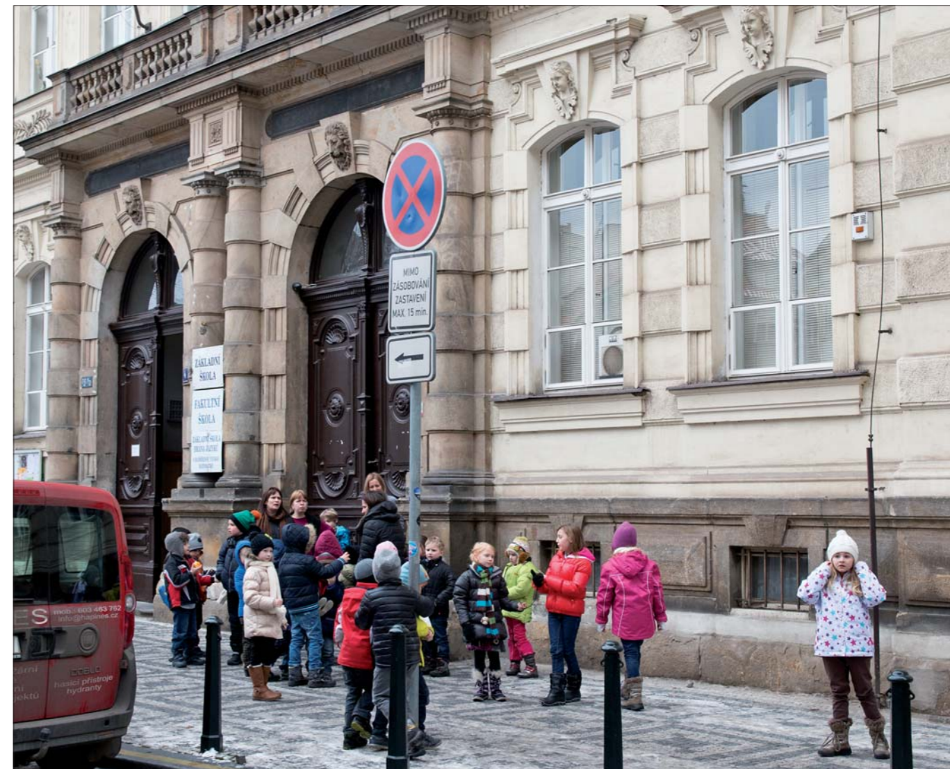
Také ve školách v Praze 1 si 30. ledna děti přišly pro pololetní vysvědčení.

Nová škola se jmenuje Brána jazyků s rozšířenou výukou matematiky a dovoluji si prohlásit, že právě udržení té matematické větve je jen naše zásluha. Proč? No proto, že „matematika“ není ani dnes moc oblíbená a všichni se spíše orientují na jazyky a dnes si bohužel bez chytrého telefonu nedokážeme přepočítat