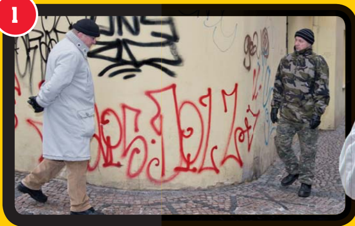
1. Útočník si vyhlédl náhodnou oběť.