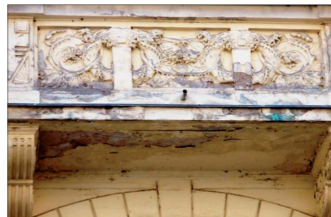
Široká 10 - před