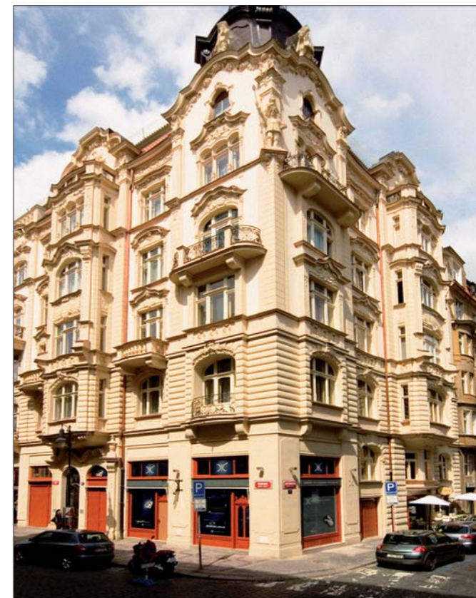
Široká 25 - po