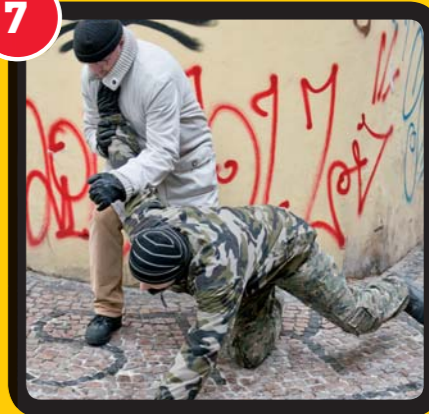
7. Průběh strhnutí se stálým tlakem na loket útočnicka.