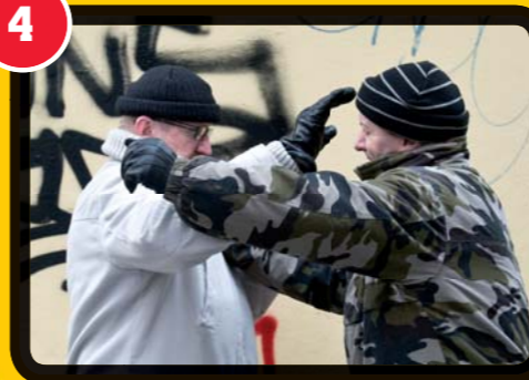
4. Útok byl vyblokován.