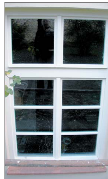
Detail okna Újezd 29 – po