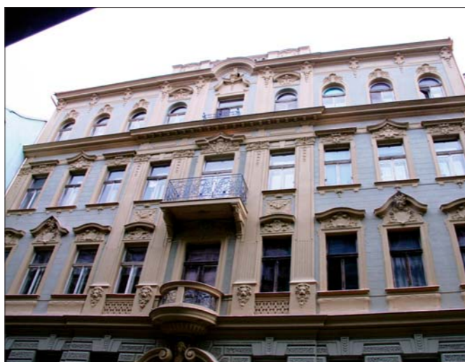
Fasáda Ve Smečkáč 6 – po