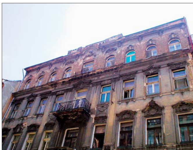
Fasáda Ve Smečkáč 6 – před