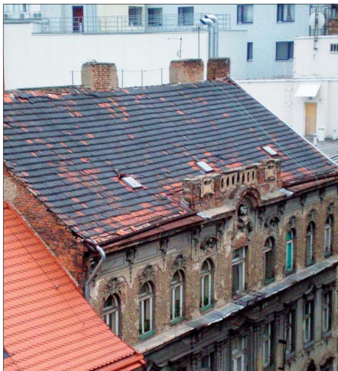
Střecha Ve Smečkáč 6 – před