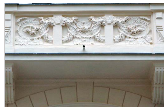
Široká 10 - po