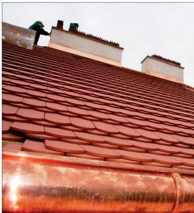
Střecha Ve Smečkáč 6 – po