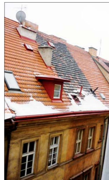
Střecha V Kotcích 18 – před