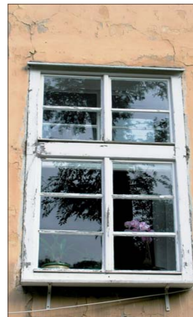
Detail okna Újezd 29 – před