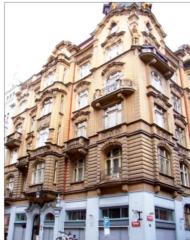
Široká 25 - před

Přes počáteční politickou názorovou rozkolísanost se podařilo uskutečnit v následujících letech celkem 3 grantové programy (v roce 2008, když bylo v prvním kole pro přísné podmínky vyřazeno až 55 % žadatelů se uspořádalo mimořádně i II. kolo). Do těchto pro-