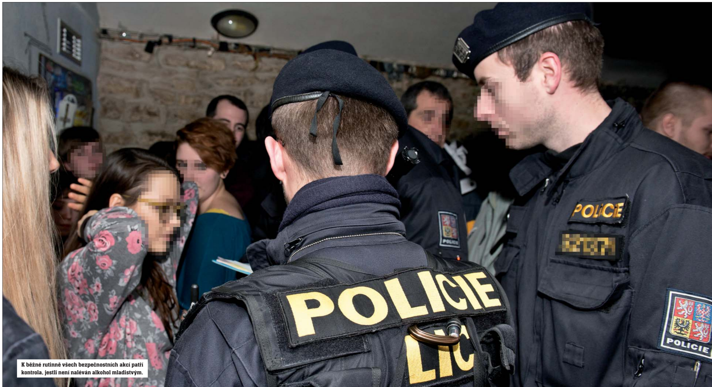
K běžné rutinně všech bezpečnostních akcí patří kontrola, jestli není naléván alkohol mladistvým.

Výstavbou „chytrého“ kamerového systému v průběhu dvou let pak hodláme dosáhnout vytvoření podmínek pro rychlý zásah obou policií v případě rušení nočního klidu a dalších případech nepřistojného chování. Nedovolíme decibelům, aby ovládly Staré Město. RED