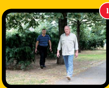
1 Zamyšlený chodec v parku nic netuší.

Útočnickova akce je rychlejší než obráncova reakce, neboť ten vždy jedná s určitým zpožděním. Útočník je ve výhodě – útok zahajuje a volí místo, zbraně, směr, rytmus apod., nezajímají ho právní důsledky, etické normy atd.