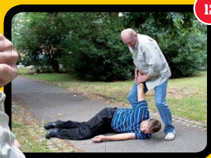
Po dopadu zablokujeme ruku.