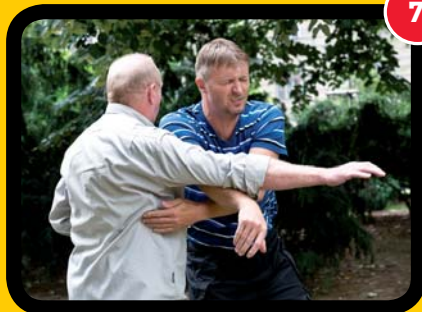
7 Detail přitažených rukou.