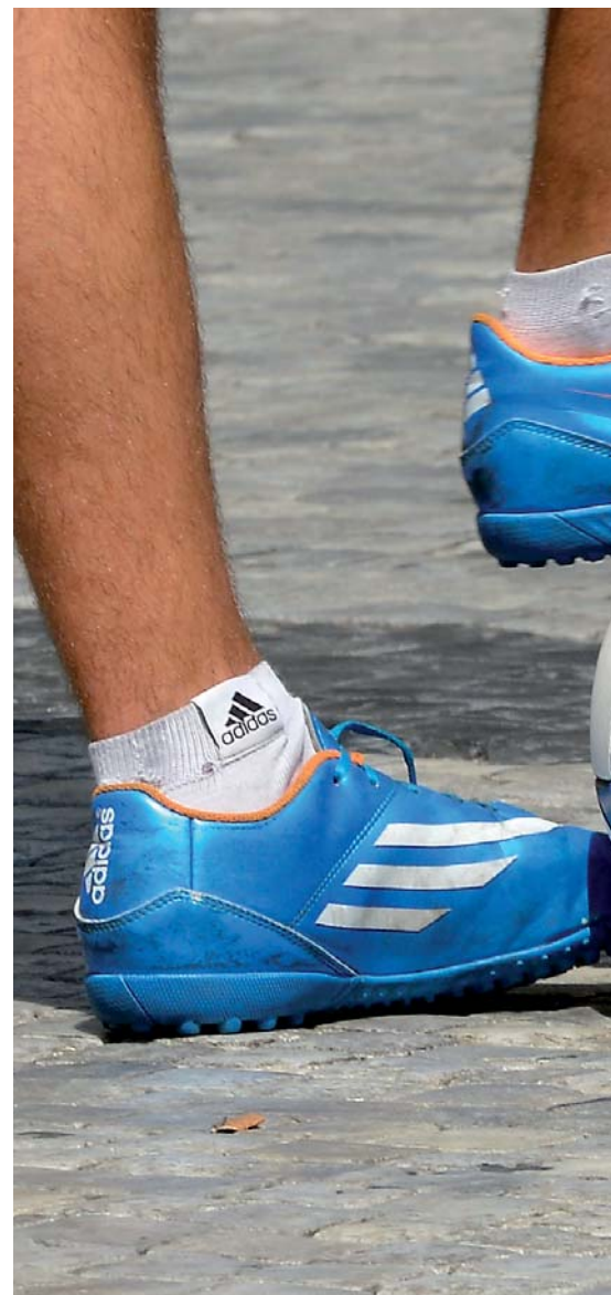
Fotbal je nejpopulárnější hrou na světě...

A pak zde z němčiny máme ještě „špek“ (Speck). Základní význam je samozřejmě „slanina“ a s ním související frazeologismus (ustálené slovní spojení) „skočit na špek“ (jako myš), tzn. „dát se nacytat na vnaidlo“, „nechat se oklamat“: když sudí „skočí hráči na špek“, znamená to většinou, že mu „spolkl“ nafilmovaný faul... Slangově znamenají „špeky“ něco zajímavého, zvláštního, mimořádného: „Autor vybral při čtení ze své knihy špeky“, tedy něco tučného, výživného... Vedle toho jsou ve studentském slangu „špeky u zkoušky“ prostě „chytáky“. A od těchto dvou odstínů slaniny se asi odvozuje fotbalový „špek“, tj. obtížně zpracovatelná příhrávka.