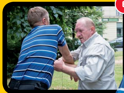
6 Tvrký úder s přitažením rukou.