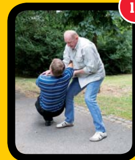
Útočník před dopadem na tvrdo.