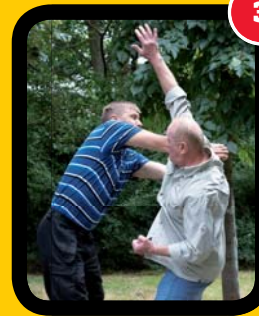
3 Okamžitá reakce, rychlé vytočení se zvednutou rukou, která útočníka vychýlí.