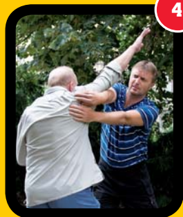
4 Detail vychýlení.