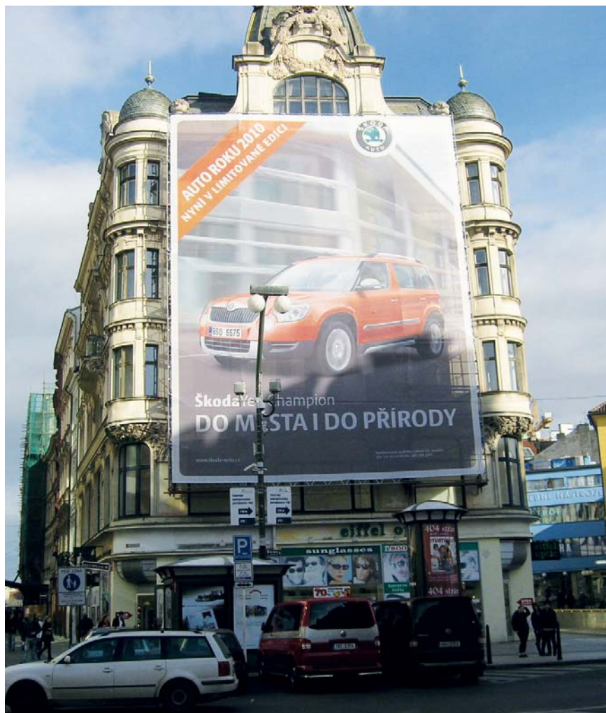
Falešným stavbám odzvonilo.

zastupitel Prahy 1 za TOP 09, předseda Bezpečnostní komise Prahy 1 zdenek.skala@praha1.cz