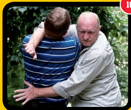
Detail rukou, které jdou do stříhu.