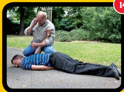
Zakleknutí a přivolání policie.