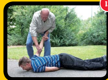
Přetočení na břicho.