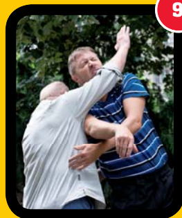
Detail úderu předloktím.