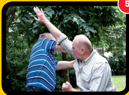
5 Odkrytí boku útočníka.