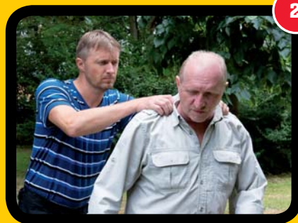
2 A je náhle překvapen.