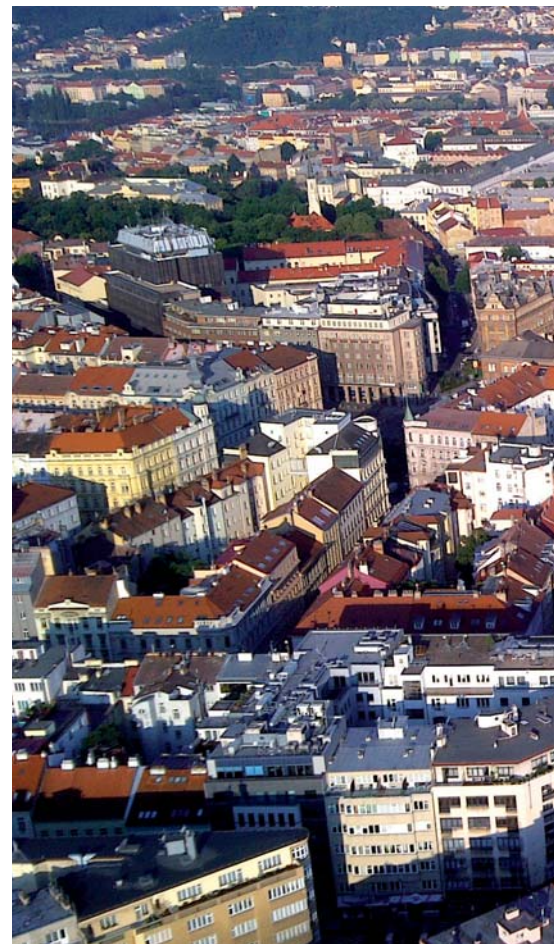
Základním kamenem bytové koncepce jsou malometrážní byty.

Po celou dobu působení TOP 09 na radnici se držíme striktních pravidel, které nezbytně vycházejí z výše uvedeného. Základním kamenem naší bytové politiky, chcete-li bytové koncepce, jsou malometrážní byty. Byla to právě TOP 09, která zavedla již v roce 2011 striktní pravidlo, že se s každým volným menším bytem seznámí vedoucí sociálního odboru, která odborně posoudí, zda je daný byt vhodný, či není, pro sociální využití. Díky tomu se podařilo zařadit do tzv. „sociální rezervy“ cca 50