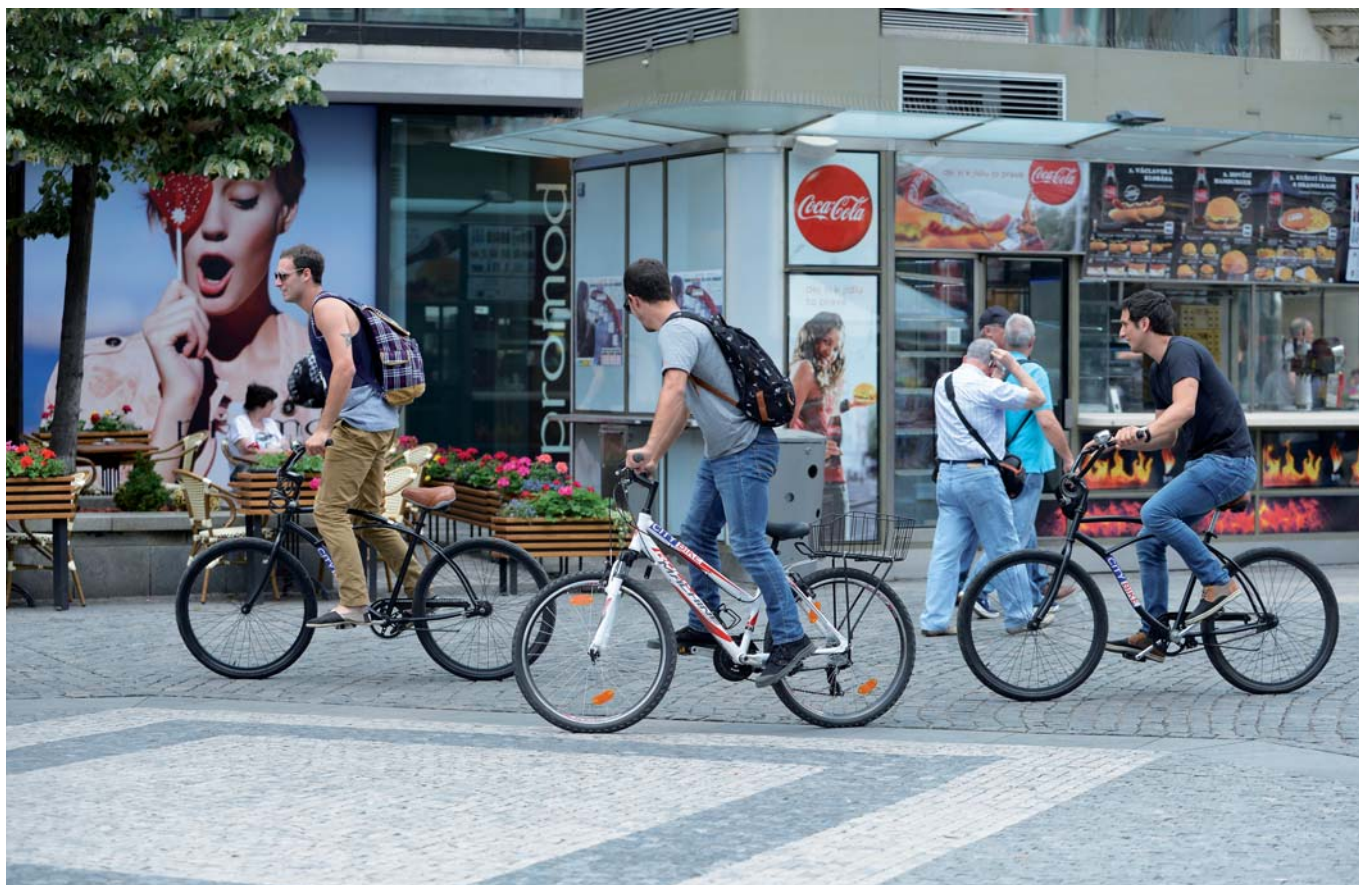
Cyklistiku je třeba vidět v souvislostech.