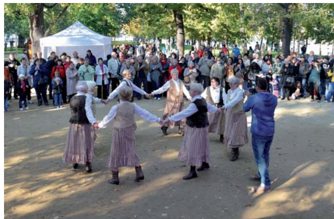
Moderní stáří je převážně aktivní.

Na jedné straně je s odchodem do důchodu spojená podstatná změna denního programu i společenského statutu. Na druhé straně je stáří vždy jen pokračováním předchozího života. Přesto bývají seniorům připisovány poněkud odlišné hodnoty a priority. Senioři vnímají život z jiného úhlu pohledu než mladí. Končí svou pracovní aktivitu, nechávají za