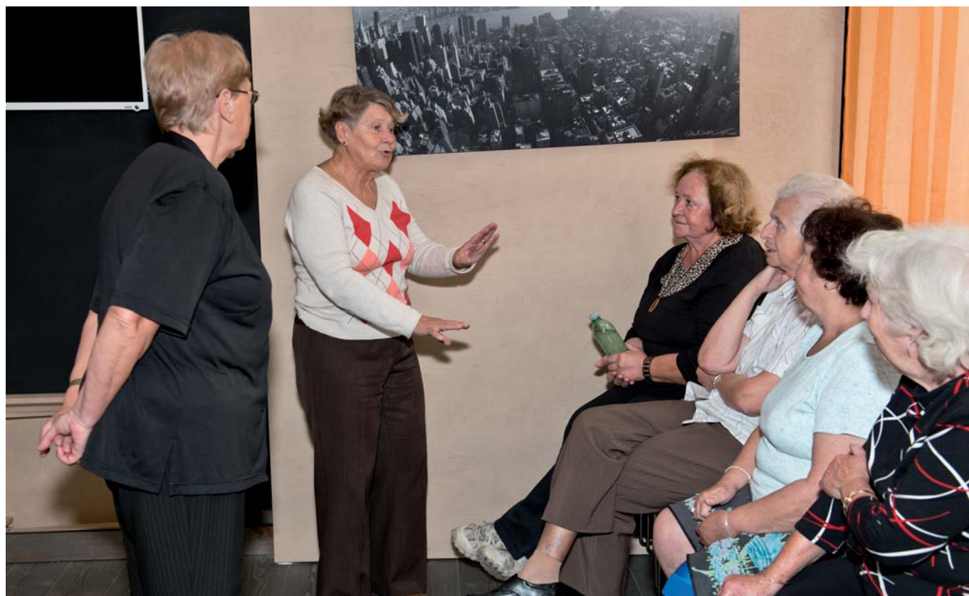
Není nad společně strávený čas v příjemném kolektivu.