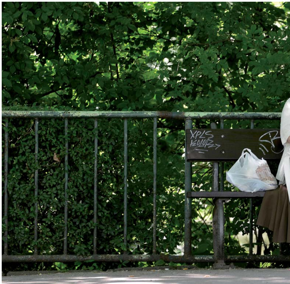
Spokojené stáří? V Praze 1 toto slovní spojení platí!

Tato péče je určena těm našim spoluobčanům, kteří dosáhli důchodového věku, a pro občany, kteří jsou plně invalidní. Občan je přijat na základě žádosti. Přesto je podmínkou přijetí takový zdravotní stav, kte-