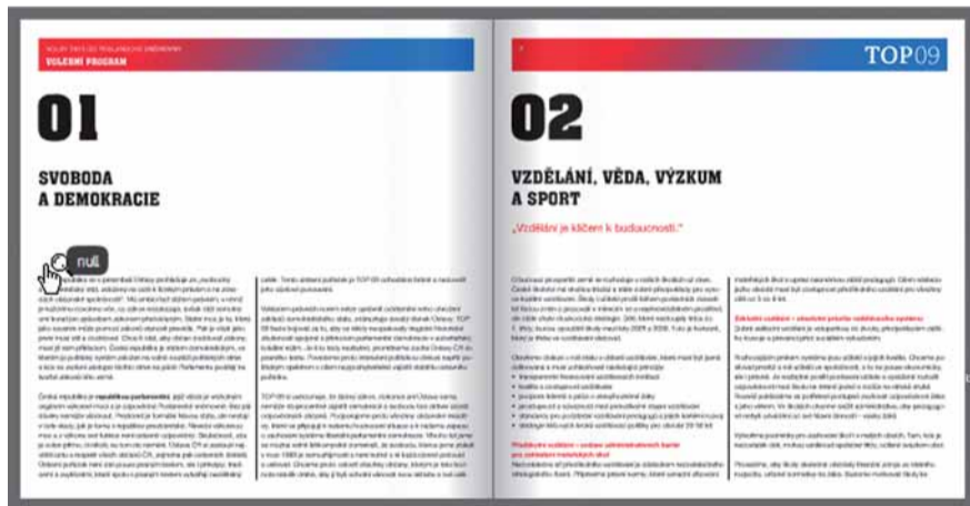
Ukázka dvoustrany volebního programu TOP 09. Více na http://www.top09.cz/proc-nas-volit-volebni-program/volebni-program-2013/

Celý program je ke stažení na www.top09.cz